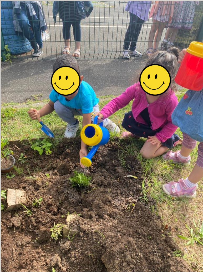
Les élèves du Pôle MTA