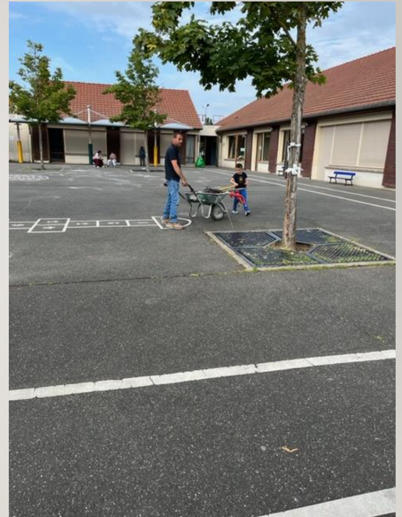
Un papa et son fils