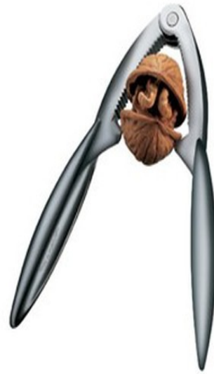
Un casse noix