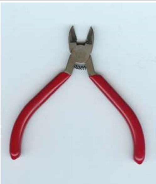
Une pince coupante