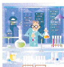
Microsoft Collection Clipart Word 2010

Concept : Créer un jeu d'évasion où chaque énigme résolue (un exercice de mathématiques) donne une pièce d'un puzzle.