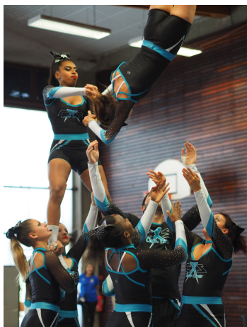
Club Cheer Excess