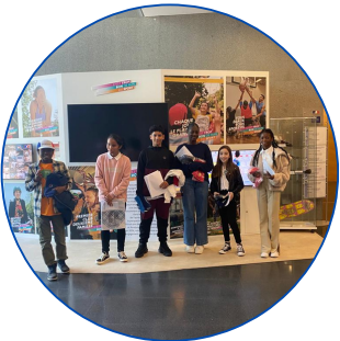
Les collégiens de Boileau à Chennevières-sur-Marne

Ni une ni deux ! À l'évocation de ce défi particulier, inspirés par le pôle JOPARTISTIK, les élèves de l'école d'application Pasteur à Fontenay-sous-Bois ont réalisé un 3 en 1 : créer, chanter, danser ! Une prouesse artistique devenue possible grâce à l'accompagnement de leur enseignante et grâce à l'esprit créatif du conseiller pédagogique en éducation musicale. De cette collaboration est né l'hymne " Ouvrons grand les Jeux " qui sera interprété pour la première fois à la cérémonie d'ouverture de l'évènement J-400.