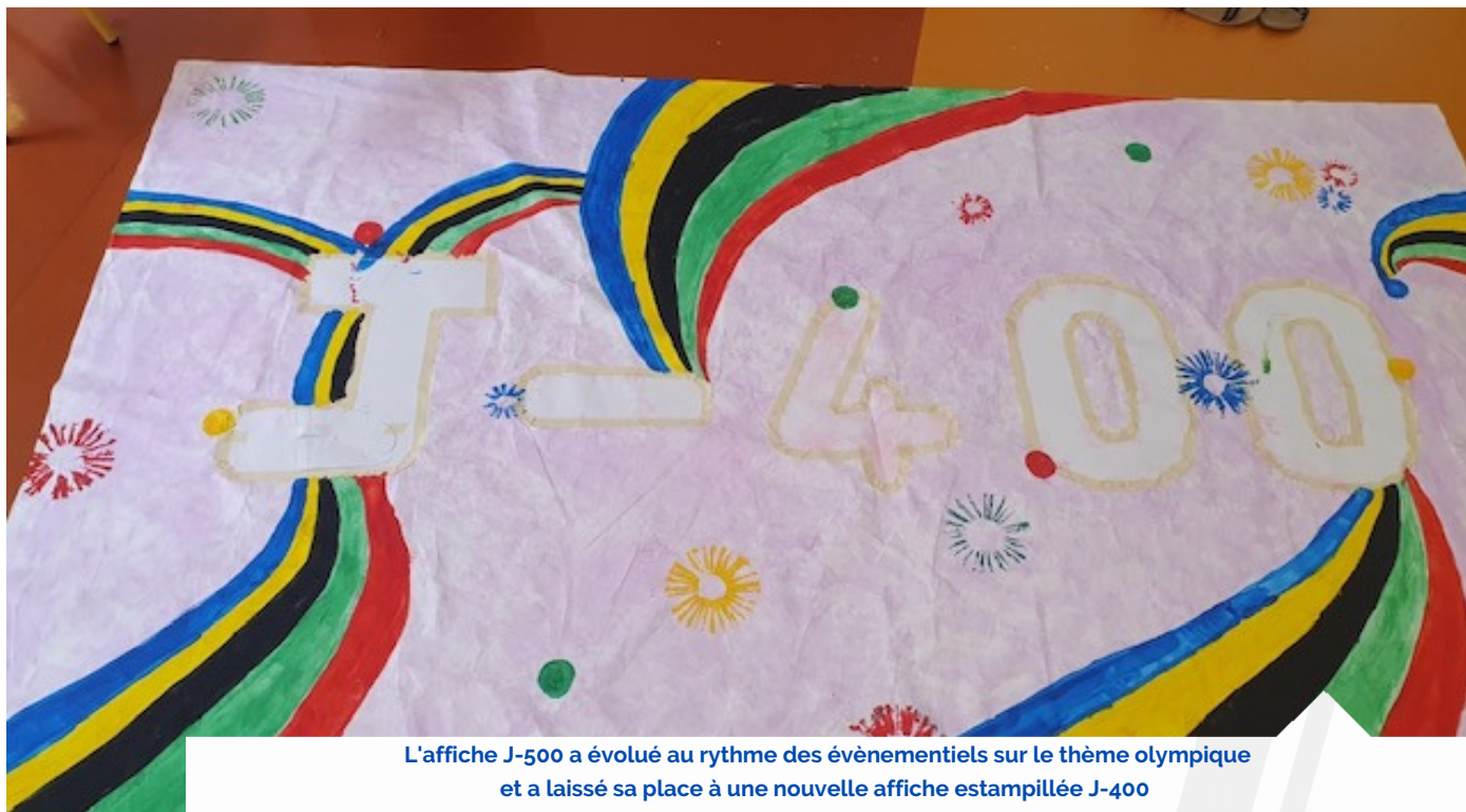
L'affiche J-500 a évolué au rythme des événementiels sur le thème olympique et a laissé sa place à une nouvelle affiche estampillée J-400